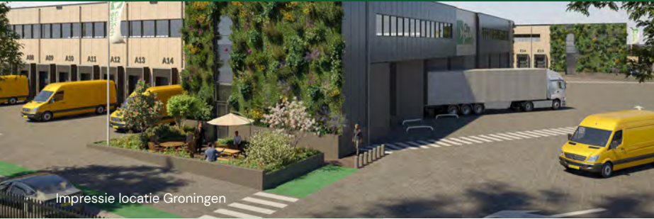
Impressie locatie Groningen